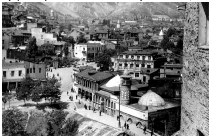
Yadigar oğlu Sadıqın divarının bir tərəfinin şah Abbas məscidi olan sarayından bir görünüş.