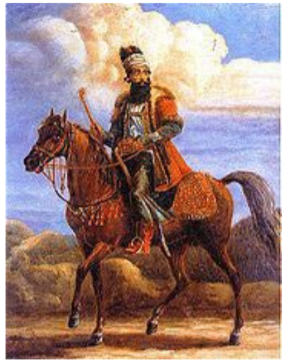
II İrakli qırmızı Qarabağ atında.